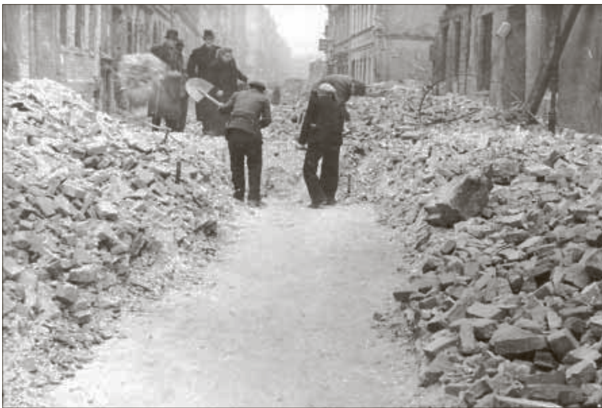
SAMTIDSRUINER: Berlin etter et bombeangrep, 3. februar 1945. Stig Dagerman besøkte ruinlandskapet året etter.

Dagerman får midt i fleisen det tyskerne selv må prøve å lukke øynene for. Han reiser gjennom et rasert land og får høre at forholdene er «ubeskriverlige», at de ubestemmelige ingrediensene folk koker sammen i grytene sine er «ubeskriverlige». «Nei», er forfatterens enkle poeng: «Det er meget uappetittelig, men det uappetittelige er ikke ubeskriverlig, bare uappetittelig. På samme måte kan man imøtegå den påstand at barnas lidelser og hele deres måte å leve på er ubeskriverlig. Hvis en vil, lar det seg meget godt gjøre å beskrive det.» Dermed har Dagerman annonsert sin ambisjon, og han innfrir til fulle. For en observasjons-